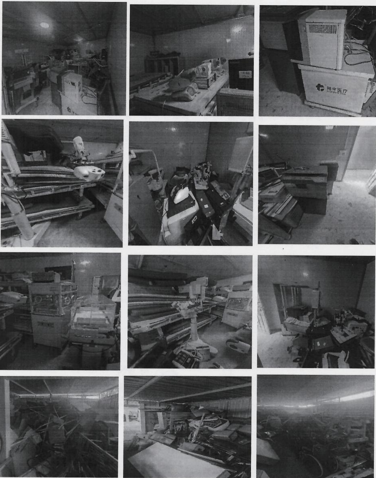
件 2: 委估资产相关照片